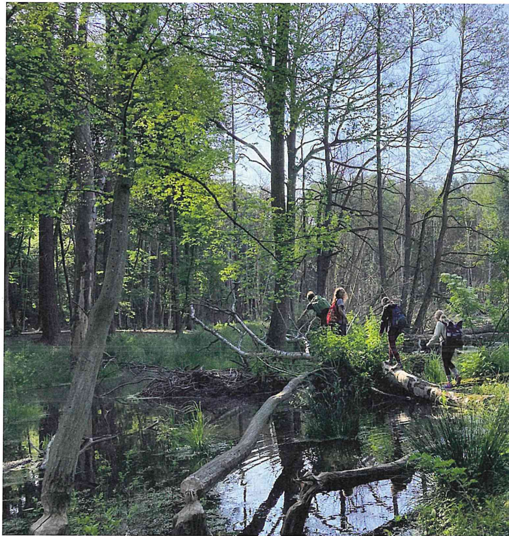
Nah an der Natur: Umweltbildungsprojekt der Stiftung WaldWelten

Im Jahr 2012 erwarb die Stadt Eberswalde die beiden historischen und denkmalgeschützten Forstschreiberhäuser am Schwappachweg im Rahmen eines Tauschgeschäfts mit dem Landesbetrieb Forst Brandenburg. Der Grundstein für den heutigen Sitz der Stiftung wurde damit gelegt – ein Ort, der mit viel Mut, ehrenamtlichen Engagement und der Unterstützung durch die Stadt zum Do-